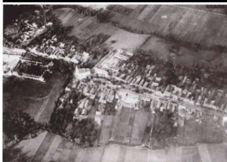
Letecký pohľad na kaštieľ

Ku kaštieľu patrili rozsiahle lúky, polia a peňažné výnosy. Majiteľ kaštieľa mal právo zriaďovať viechu, ktorá bola znakom predaja vína. V Suchej sa hovorievalo: „ A keď zme aj to vínko voláke mali, boli tí víchi, ráda zme vedzeli, jakí aj ten má aj čo. “ Do začiatku 17. storočia sa vína mohli predávať len vo vlastnom dome „pod viechou“, najčastejšie od sviatku sv. Juraja do sviatku sv. Michala. Vo viechach sa zvyčajne pol roka „šenkovalo“ víno so ziskom pre zemepána a pol roka pre obecnú pokladnicu.