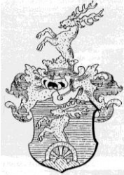
Erb rodiny Pálffyovcov.